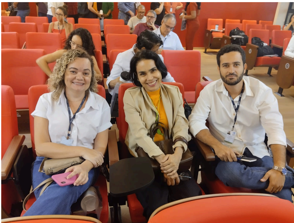
I Seminário de Gestão de Pessoas