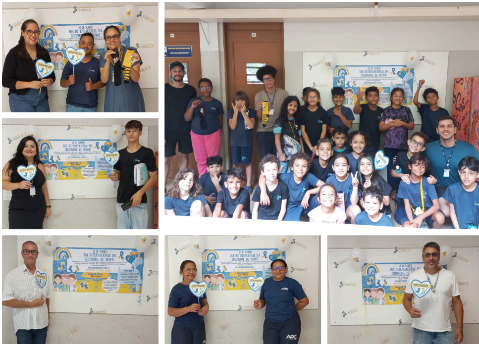
BSCEPAE promove conscientização sobre o Dia Internacional da Síndrome de Down