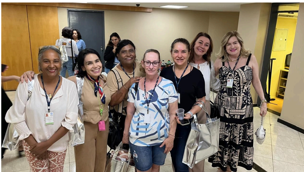
Programa de Preparação para Aposentadoria (PPA) UFG