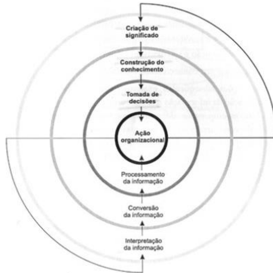
Figura 1: A organização do conhecimento – três arenas do uso da informação

Fonte: Choo, C.W. A organização do Conhecimento . São Paulo: Senac, 2003, p. 31