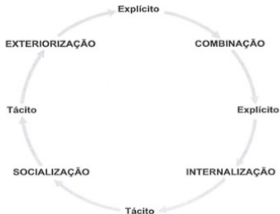
Figura 3: Processos de conversão do conhecimento organizacional

Fonte: Choo, C.W. A organização do Conhecimento . São Paulo: Senac, 2003, p. 38