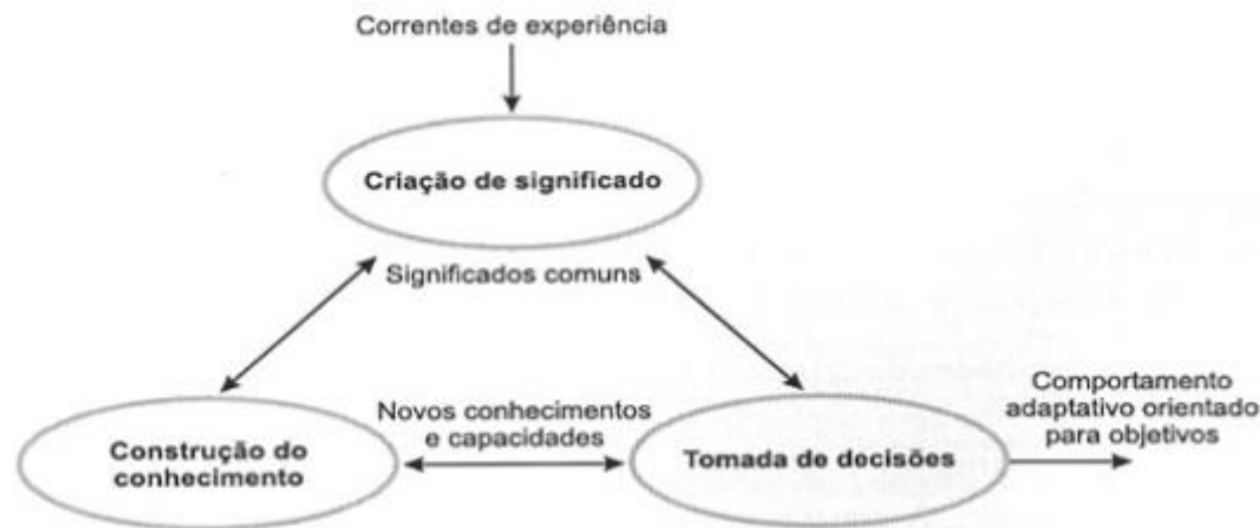
Figura 5: O ciclo do conhecimento

Fonte: Choo, C.W. A organização do Conhecimento . São Paulo: Senac, 2003, p. 51