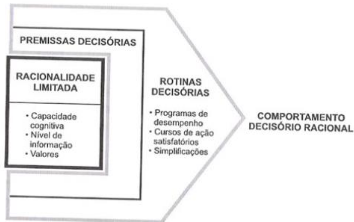
Figura 4: Aspectos dos sistemas decisórios de uma organização

Fonte: Choo, C.W. A organização do Conhecimento . São Paulo: Senac, 2003, p. 44