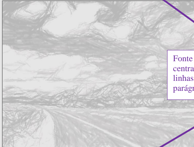
Figura 1.1. Título da Figura.

Texto texto texto texto texto texto texto texto texto texto texto texto texto texto texto texto texto texto texto texto texto.