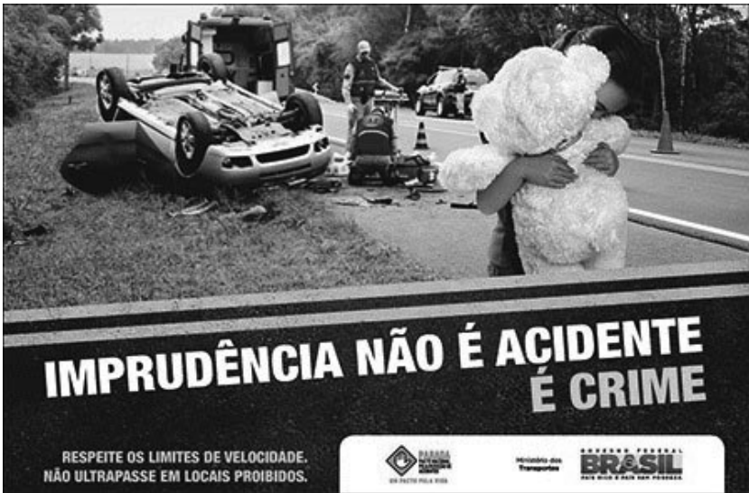
Figura 12.1 Peça publicitária do Ministério dos Transportes