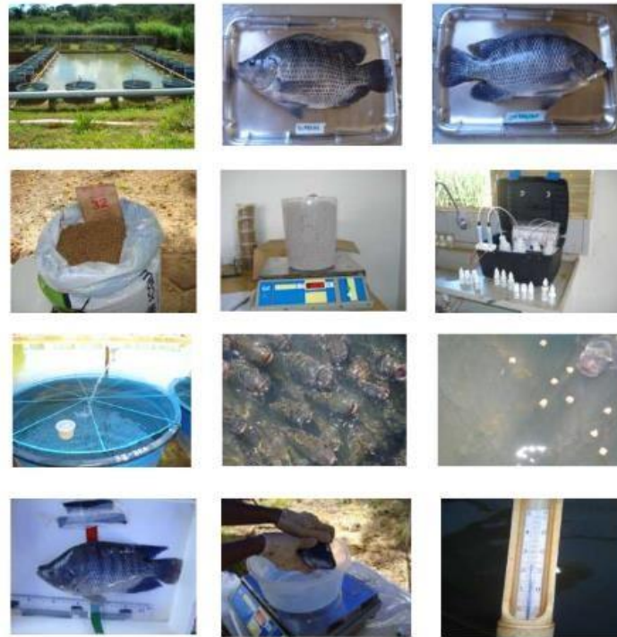
FIGURA 1 - Sequência de figuras representativas das práticas e materiais utilizados no experimento: A) Unidades experimentais – caixas d'água adaptadas como tanques raceways ; B) Exemplar de tilápia-do-Nilo, linhagem supreme; C) Exemplar de tilápia-do-Nilo, linhagem chitralada; D) Ração experimental; E) Pesagem da ração; F) "Kit" de análise química de água; G) Abastecimento de água individualizado para cada tanque com tela de proteção; H) Animais aguardando o arçoamento; I) Ingestão de ração; J) Biometria final-avaliação do comprimento; K) Biometria final – Pesagem; L) Termômetro de bulbo de mercúrio.