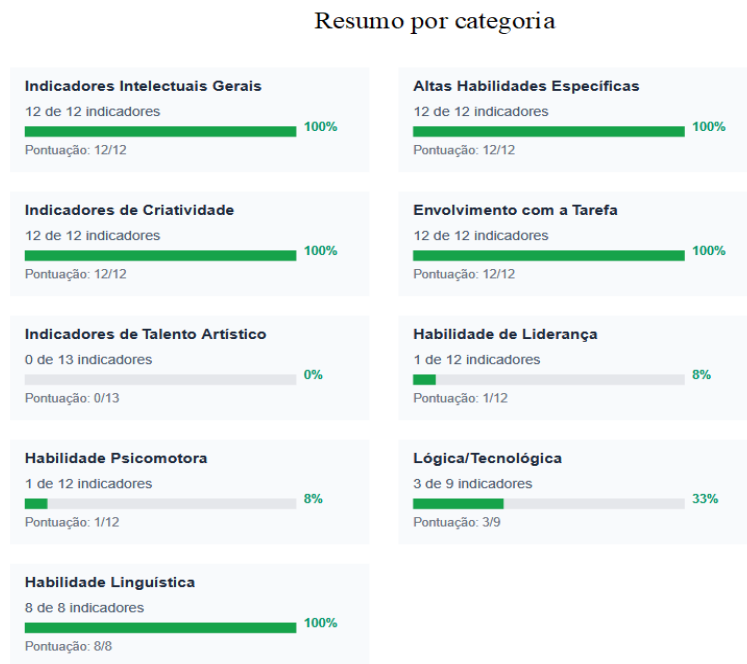
Figura 15: Resumo por Categoria