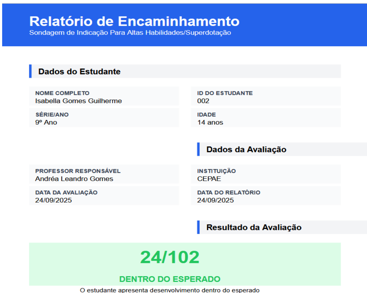
Figura 7: Relatório de Encaminhamento

O relatório de encaminhamento, é gerado em forma de PDF e o NAAH/S consegue visualizar todas as características do educando, sendo possível ver o resumo da categoria por pontuação, porcentagem e após descritores positivos identificados como segue nas figuras abaixo: