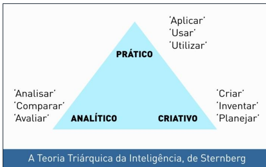
Figura 3. A Teoria Triárquica da Inteligência

(...) as três capacidades que constituem a inteligência plena são a analítica, a criativa e a prática. A capacidade analítica é usada quando a pessoa analisa, avalia, compara ou contrasta. A capacidade criativa é utilizada quando a pessoa cria, inventa ou descobre. A capacidade prática é empregada quando a pessoa coloca em prática, aplica ou usa aquilo que aprendeu. (...) As pessoas plenamente inteligentes apresentam um equilíbrio entre esses três tipos de pensamento (p.21)