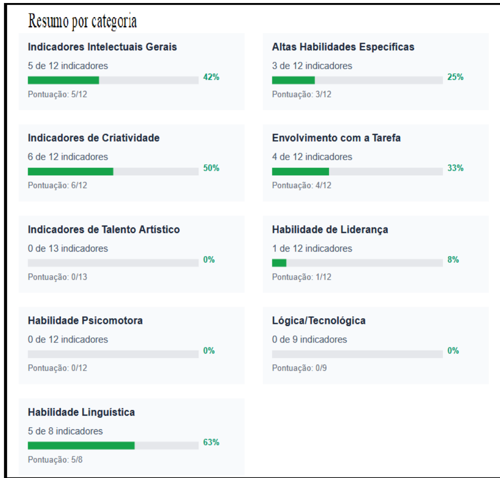
Figura 8: Resumo por categoria