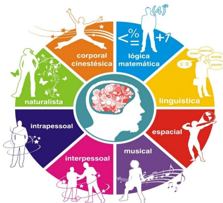
Figura 2. Práxis Educativa: Inteligências Múltiplas de Howard Gardner (2018).