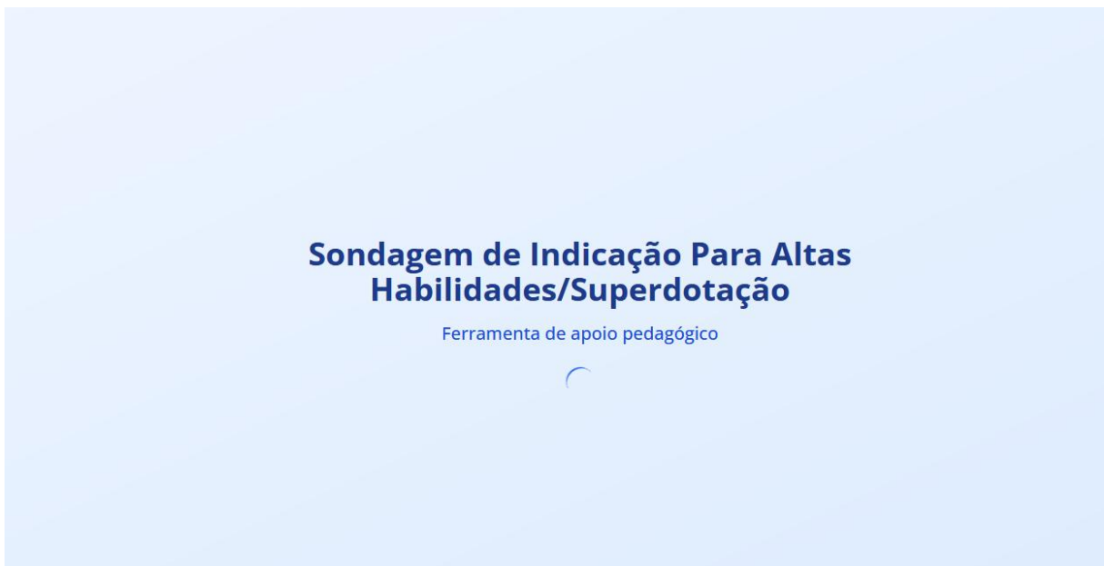
Figura 2: 2ª Capa SIPAHS