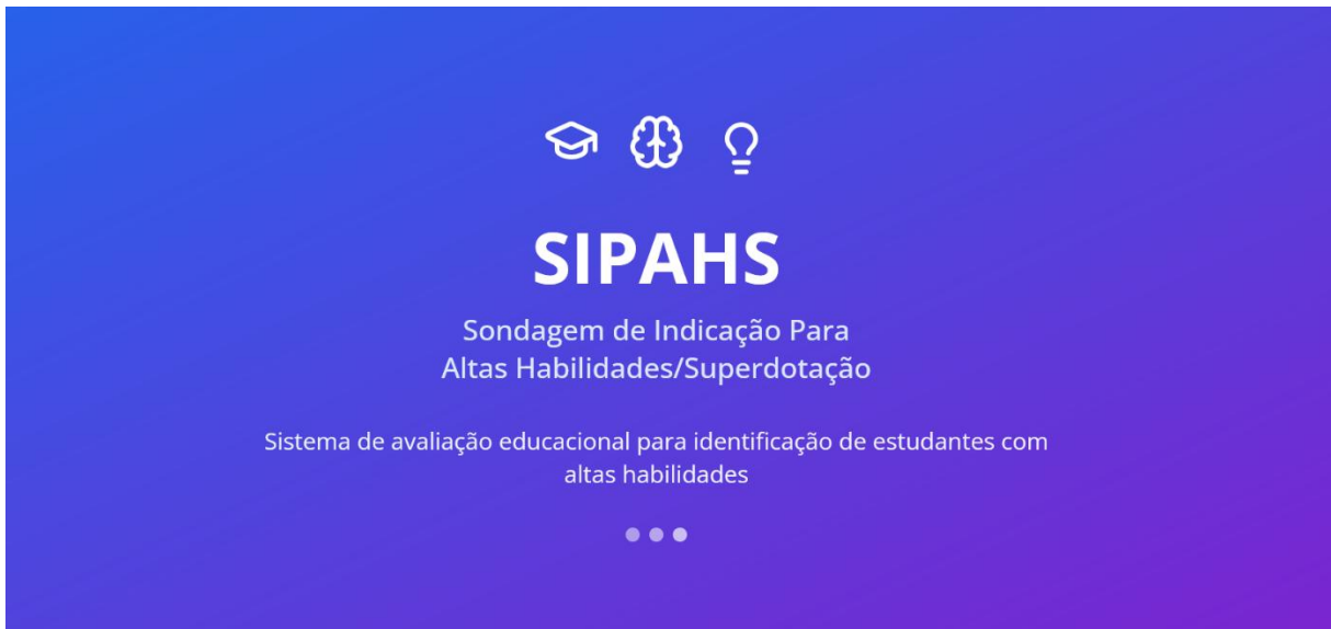
Figura 1: 1ª Capa SIPAHS