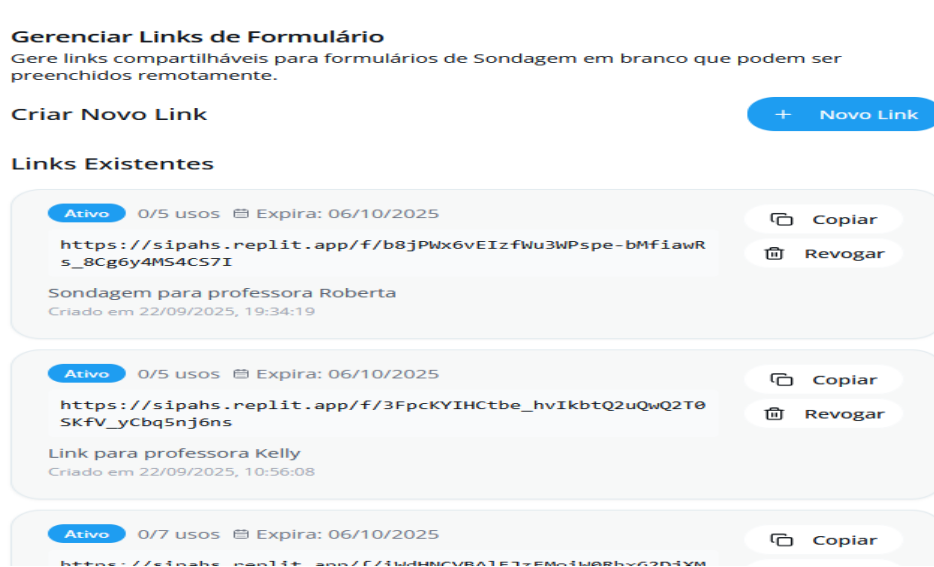
Figura 18: Gerenciamento de Links