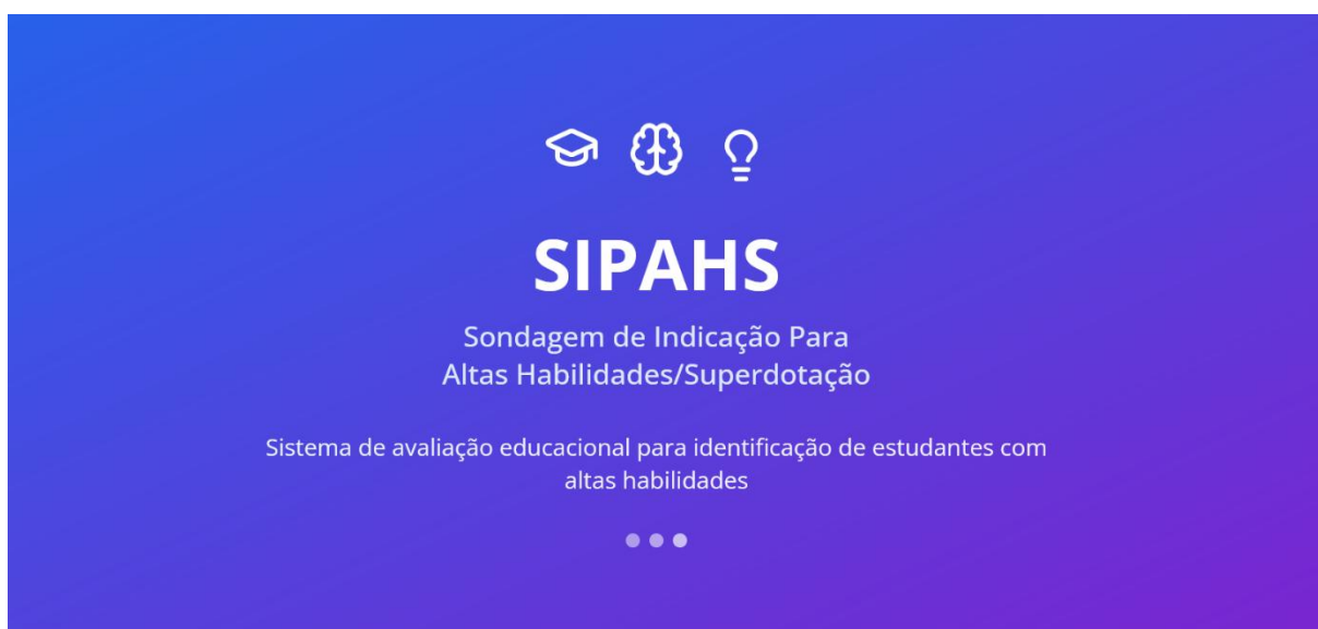
FIGURA 4 -1ª Capa do SIPAHS