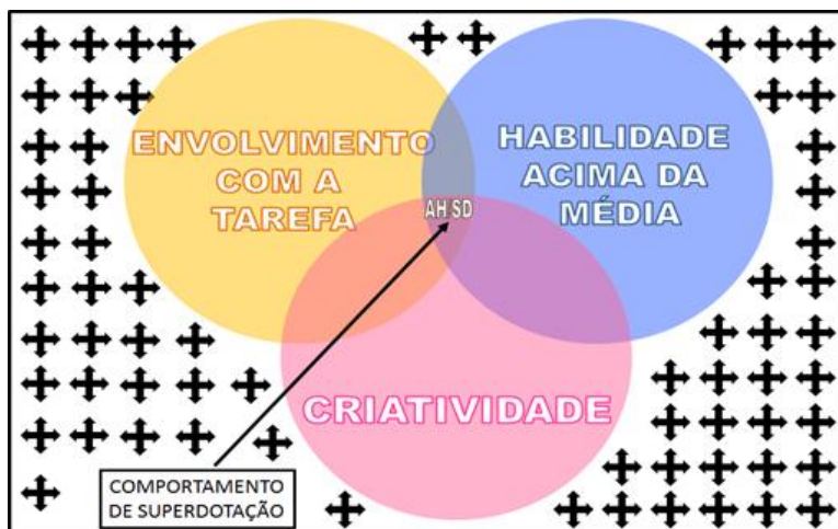
Figura 1- Diagrama da Teoria dos Três Anéis - proposto por Joseph Renzulli (1979).

Renzulli teve um interesse maior na superdotação criativa-produtiva e com base em estudos sobre indivíduos que se destacaram por seus talentos criativos, propôs uma concepção da Teoria dos Três Anéis, que inclui os seguintes componentes: habilidades acima da média, envolvimento com a tarefa e criatividade.