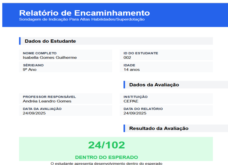
Figura 14: Relatório de Encaminhamento

O relatório de encaminhamento é acompanhado por um resumo analítico da categoria, no qual se apresenta um panorama geral das características observadas, organizado em percentuais que expressam a frequência dos indicadores identificados, além da listagem dos descritores positivos selecionados pelo(a) responsável pela sondagem. Esse recurso tem como finalidade oferecer uma visão sintética e sistematizada dos dados coletados, facilitando a etapa subsequente de análise e tomada de decisão quanto ao encaminhamento do(a) educando(a). Cabe salientar que, nesta fase do processo, o acesso integral a essas informações é restrito ao(à) administrador(a) do software, o que assegura a confidencialidade dos registros e a integridade do processo avaliativo. As imagens a seguir ilustram a forma como essas informações são apresentadas na plataforma.