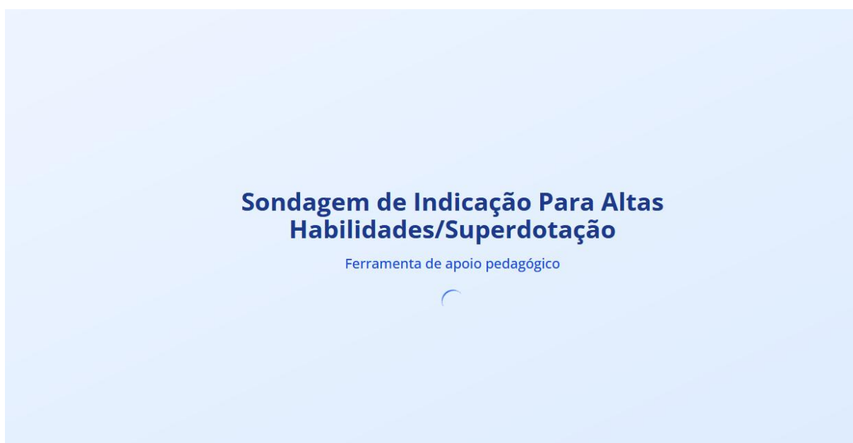
FIGURA 5 -2ª Capa do SIPAHS