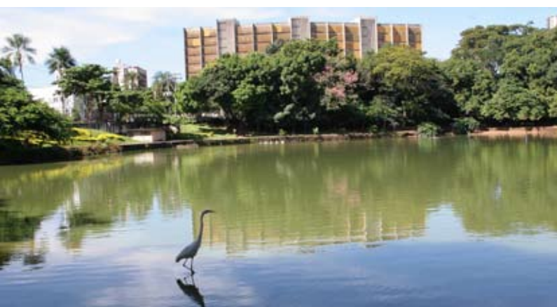
Site Prefeitura de Goiânia

Bois des "Buritis". Le plus ancien patrimoine en paysage de Goiânia a un local approprié pour la gymnastique, une fontaine et une piste de cooper, comme aussi trois lacs artificiels. Dans ce bois, se trouvent le Musée d'Art de Goiânia, le Centre Livre des Arts, Le Monument pour la Paix et une fontaine qui atteint jusqu'à 60 mètres de haut, étant la plus haute de l'Amérique du Sud. Localisation: Alameda dos Buritis, au croisement de l'avenue Assis Chateaubriand et la rue 1, Secteur Ouest.