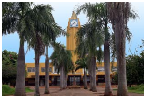
Site Prefeitura de Goiânia

Dans le style art-déco, l'immeuble possède des murales de frei Nazareno Confaloni dans la salle interne principale, peints en 1953. Pendant plus de vingt ans, elle a été de gare ferroviaire de Goiânia mais a été désactivée dans les années 70. Avec la suppression de la Ligne Ferroviaire de Goiás, la locomotive n.º 11, symbole de la gare, connue comme Marie Fumée, a été mise en exposition dans la partie externe de l'ancienne Gare. En 1987, a été créé le Centre d'Artisanat de l'Etat de Goiás, qui fonctionne dès cette époque dans l'immeuble de la gare. L'immeuble a été préservé aussi comme patrimoine par le Gouvernement de l'Etat en 1998.