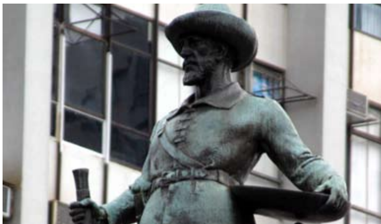
Site Prefeitura de Goiânia

Monument au "Bandeirante". Sculpture en bronze de 3,5 mètres de hauteur représentant le "bandeirante Bartolomeu Bueno da Silva" ("Anhanguera"), debout, tenant dans ses mains le récipient utilisé par les chercheurs d'or pour laver les alluvions à la recherche de pépites d'or et armé d'une espingole. Situé Place du "Bandeirante" Secteur Central au croisement des avenues Goiás et Anhanguera.