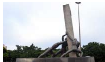
Photo: Monument des Trois Races. Sculpture de 7 mètres qui représente le noir, le blanc et l'indien, races qui ont formé le peuple "goiano". Il se localise Praça Cívica, Secteur Central (Neusa Morais, 1968).