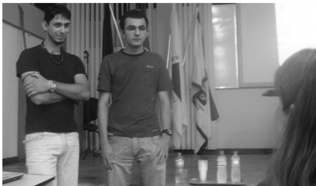
Petianos em apresentação oral no I ENAPETMat

A promoção de debates sobre temas relevantes à manutenção e ao desenvolvimento do programa PET atinge seu ápice em eventos por área (regionais e principalmente nacionais). Os encontros PET têm grande relevância para o andamento dos grupos em todo o país. É a partir das discussões e decisões desses encontros que se delibera sobre o andamento dos grupos e os encaminhamentos à Secretaria de Educação Superior (SESu/MEC).