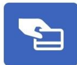
Cartão de Pagamento