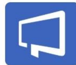
Painel de Compras