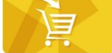
Central de Compras