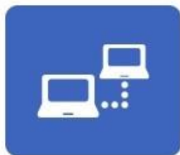
Acesso SIASG (HOD SERPRO)