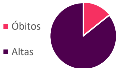
Gráfico 2: Evolução dos Casos