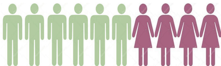
Imagem 2: Prevalência entre os Sexos