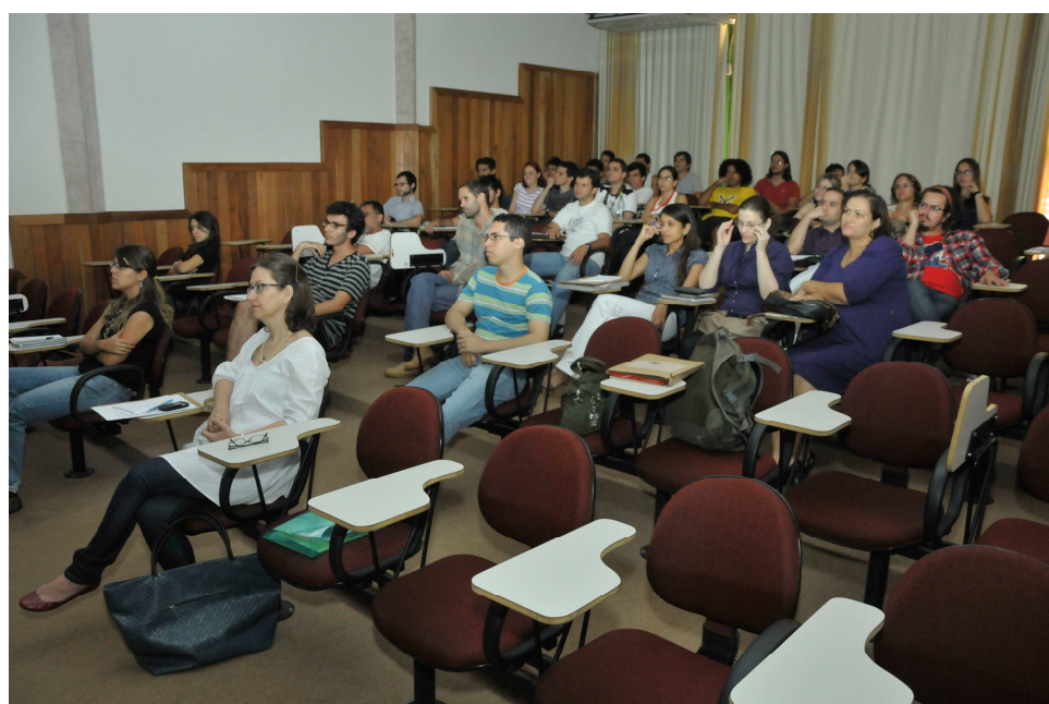
Auditório da Faculdade de Artes Visuais - UFG