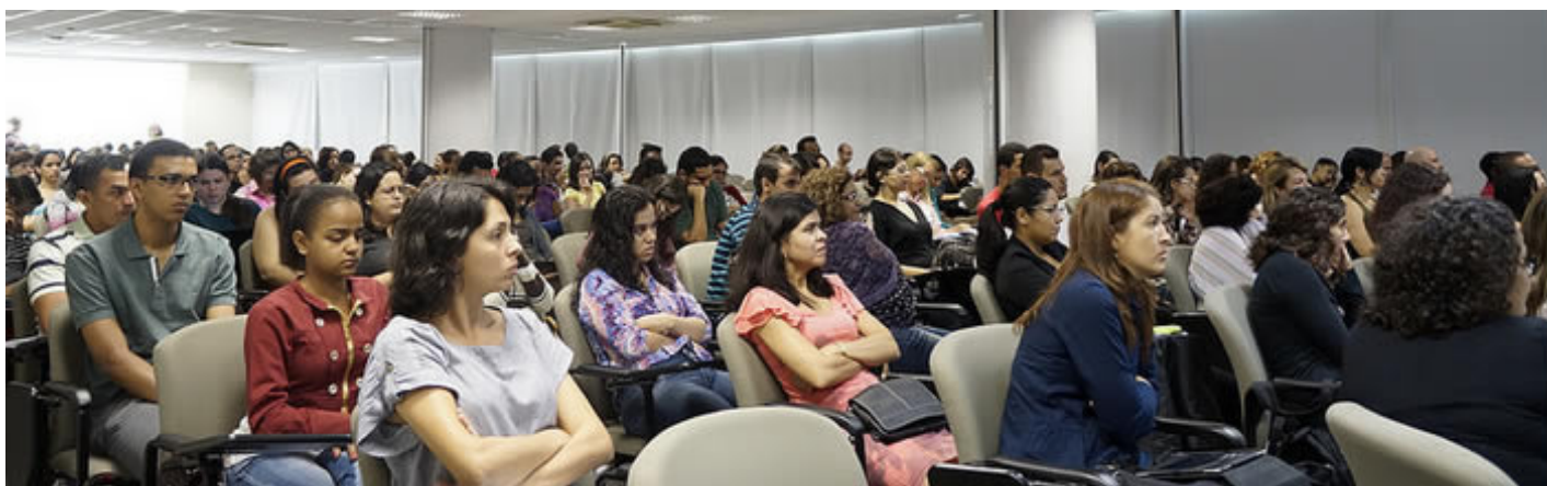
Participantes do II Colóquio Nacional de Letras e XV Colóquio de Pesquisa e Extensão.