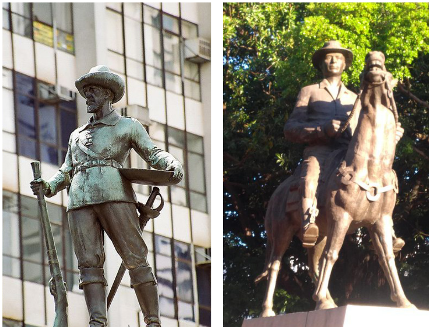
Figura 1 – Monumento ao Bandeirante e a Estátua Equestre de Pedro Ludovico, ambos localizados em Goiânia-GO. Os dois monumentos comemoram um passado idealizado e reproduzem os esquemas explicativos da memória histórica regional, marcada pelo personalismo e por uma retórica laudatória e elitista