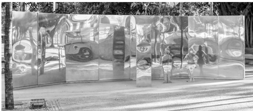
Figura 2 – Monumento a Todos Nós, localizado na Praça Cívica, em Goiânia. Ele constitui uma concepção de história que se apropria e é apropriada pelo “Eu” coletivo