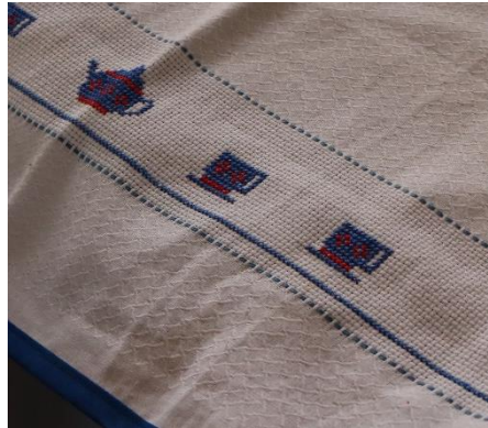
Figura 1 – Bordado em ponto de cruz