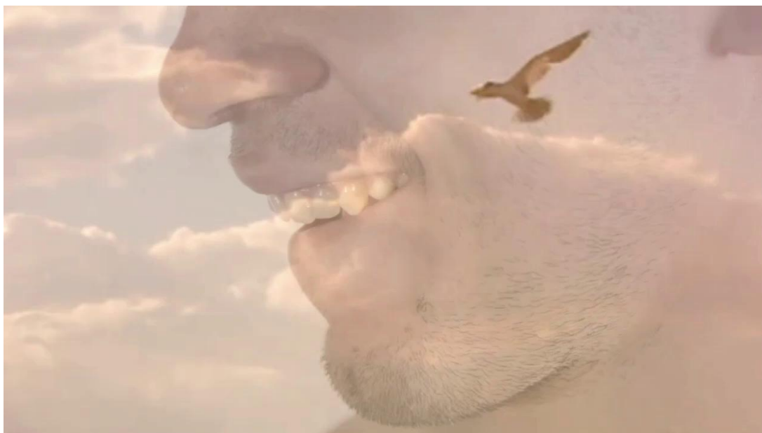
Figura 10 – Captura da tela: sequência de sugestão de troca de olhares e abordagem do outro.

Outras foram para sugerir o ir e vir, intervalos entre encontros e desencontros: