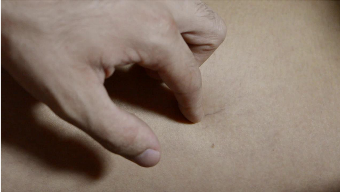
Figura 7 - Captura da tela, trecho de sugestão de aproximação, exploração e convite de interação.

Também achei coerente, pelo jogo, imagens de alguém conquistando e outro perdendo: