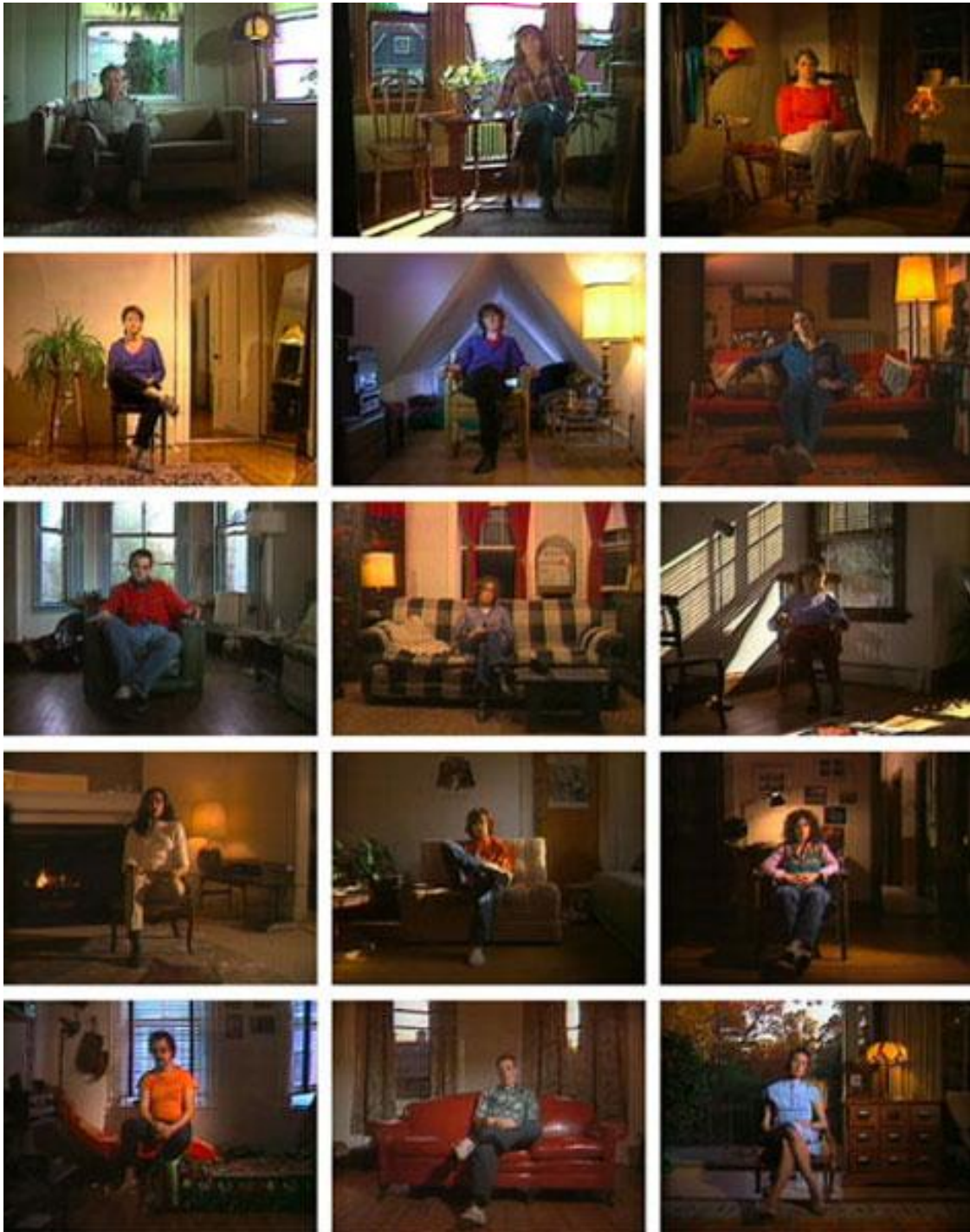
Figura 1 - Colagem de trechos da série "Reverse Television" de Bill Viola. Disponível em http://media.artabsolument.com/image/exhibition/big/VideoVintage_Paris_2012_Viola.jpg .