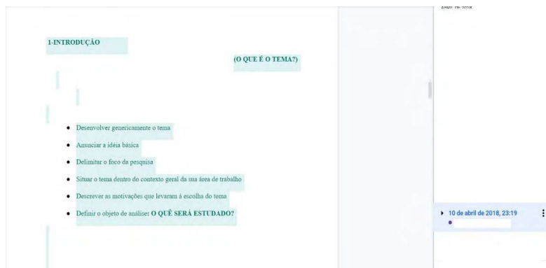
Figura 3 - Explicação da atividade a outros colegas

Embora a proposta da tarefa tivesse o objetivo de levar os alunos a trabalhar em conjunto durante todas as etapas da execução, nem sempre isso ocorreu. Em alguns grupos, foi possível perceber que um colega centralizava a tarefa, assumindo a posição de líder do grupo, delegando tarefas aos demais, ficando a cargo de explicar o que fazer aos outros ou, ainda, tomando para si a responsabilidade de formatar e dar um fechamento ao texto dos colegas. A Figura 3 representa um desses exemplos. A aluna indicada pela cor azul criou o documento e escreveu nele os itens que deveriam compor o projeto, inserindo, também, o que seria necessário escrever em cada tópico. Nas versões seguintes, o que se pôde perceber foi que cada colega assumiu um item e, ao final, a mesma colega que havia feito essa explicação inicial foi responsável pelo fechamento do texto, fazendo correções e formatando o trabalho final.