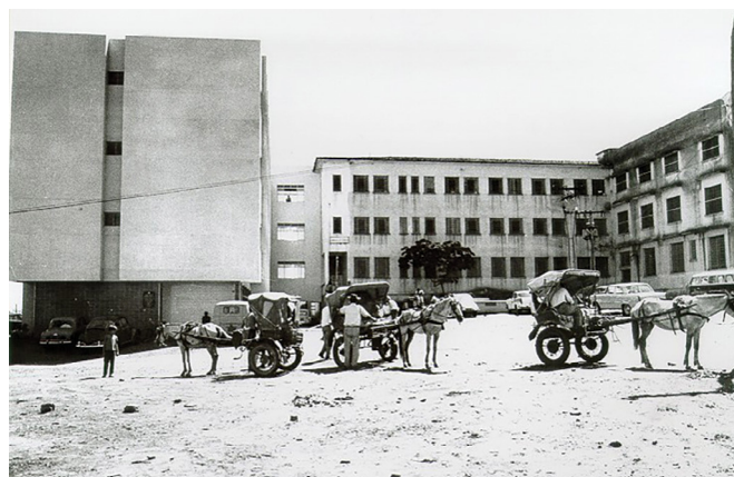
Novo pavilhão : CIR, CL.M, AMB,PS

O terceiro sentido está oculto na alma de cada docente e egresso de Escola, que se aflora com orgulho diante da proliferação de escolas privada de ensino de qualidade inferior. É uma longa história para ser contada ao longo de 66 anos (mas que está apenas no nascedouro entre universidades milenares), porém seis décadas de modernidade e um avassalador progresso.