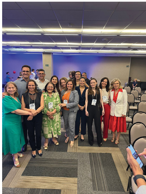
Ex-residentes presentes na homenagem recebida por ela da Sociedade Goiana de Endocrinologia.

Quando olhamos para essa trajetória de mais de quarenta anos percorrendo esses mesmos corredores, percebemos que esse caminhar deixou marcas profundas.