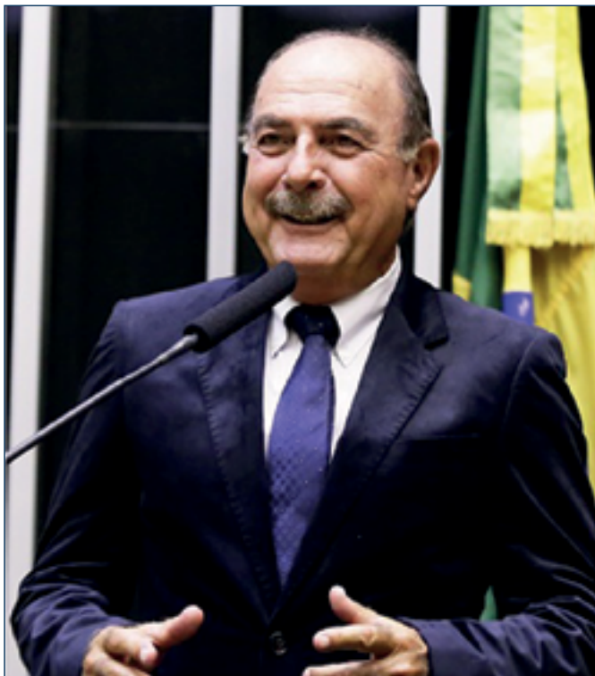
Deputado Federal Zacharias Calil (UB)

Verba será utilizada para custeio e manutenção da universidade e do Hospital das Clínicas