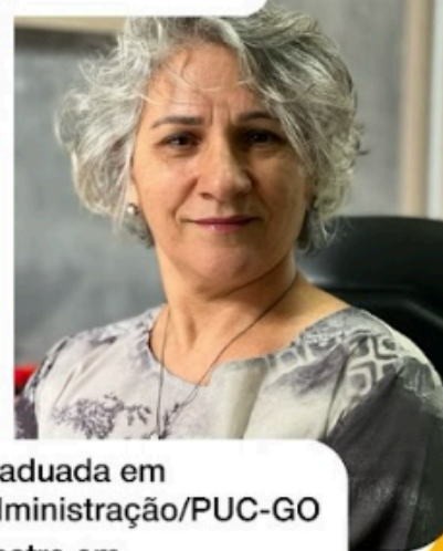
Graduada em Administração/PUC-GO Mestre em Administração/UFG

PPGIDH PROGRAMA DE PÓS-GRADUAÇÃO INTERDISCIPLINAR EM DIREITOS HUMANOS