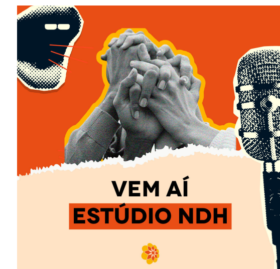
IDENTIDADE VISUAL DESENVOLVIDA PARA O ESTÚDIO NDH