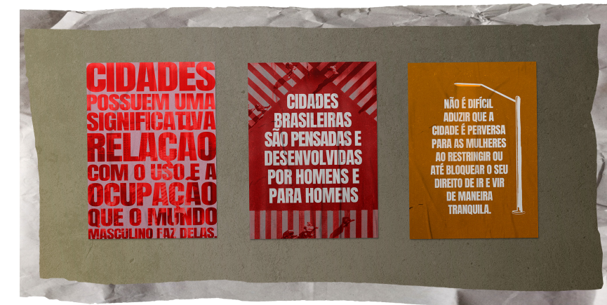
CARTAZES LAMBE-LAMBE DESENVOLVIDOS PARA DIVULGAR E CONTRIBUIR NA AMBIENTAÇÃO DO CAFÉ COM DIREITOS HUMANOS DE MARÇO