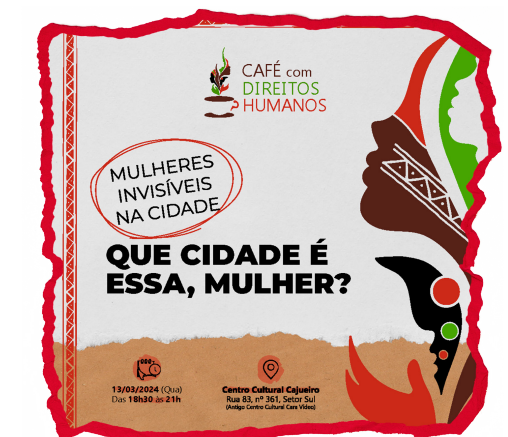
FOTOS E FLYER DA PRIMEIRA EDIÇÃO DO CAFÉ COM DIREITOS HUMANOS DE 2024, REALIZADA EM 13 DE MARÇO