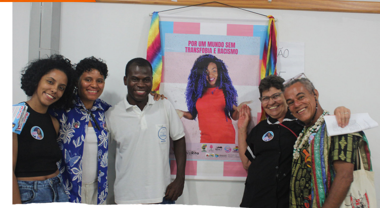
REGISTROS DA AULA MAGNA DA TURMA DO MJSP