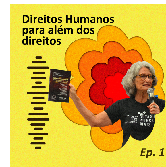
IDENTIDADE VISUAL DESENVOLVIDA PARA O PODCAST DIREITOS HUMANOS PARA ALÉM DOS DIREITOS