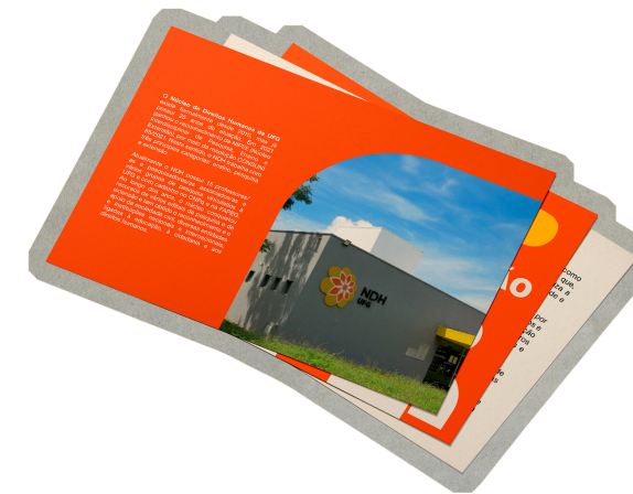
PROTÓTIPO DIGITAL DO FLYER INSTITUCIONAL DO NDH