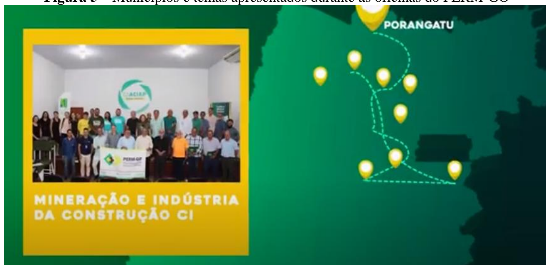
Figura 5 – Municípios e temas apresentados durante as oficinas do PERM-GO

O PERM-GO obteve também o suporte de prefeituras, entidades de classe, empresários e autoridades. Foram visitados 12 municípios ( Figura 5 ) e percorridos sete mil quilômetros no estado. Desse modo, mais de duas mil pessoas discutiram e deram suas sugestões para o desenvolvimento da mineração goiana, a partir de temas centrais como “Agregação de valor do bem mineral - desafios e oportunidades, a “Mineração como estratégia de desenvolvimento regional”, “Mineração e Infraestrutura”, “Minerais Estratégicos e Transição Energética” e a “Mineração e a indústria da Construção Civil”.