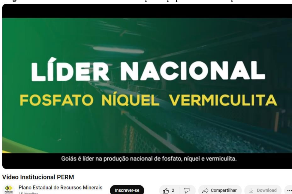
Figura 2 – Vídeo institucional elaborado pela equipe de Comunicação PERM-GO

Com a duração total de 3:13 minutos, o vídeo institucional do PERM-GO foi apresentado durante o evento “Minera GO”, realizado nos dias 12 e 13 de dezembro de 2023, na Assembleia Legislativa de Goiás (Alego). O conteúdo pode ser acessado pelo link: https://youtu.be/3LI3UZGd7LQ .