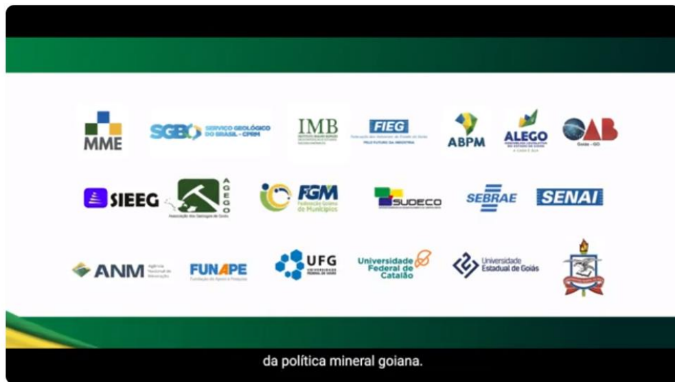
Vídeo Institucional PERM