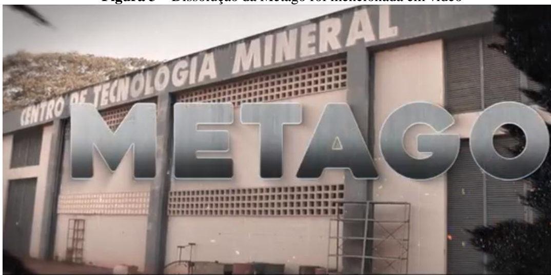
Figura 3 – Dissolução da Metago foi mencionada em vídeo

Nesse momento, o vídeo ressalta que, durante muito tempo, o setor mineral foi deslocado das pautas prioritárias do governo estadual e que, por 20 anos, toda a potencialidade da mineração goiana foi esquecida, resultando inclusive na liquidação da empresa estatal Metais de Goiás, a Metago ( Figura 3 ).