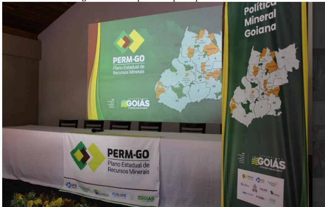
Figura 3 - Banner produzido para o palco dos eventos