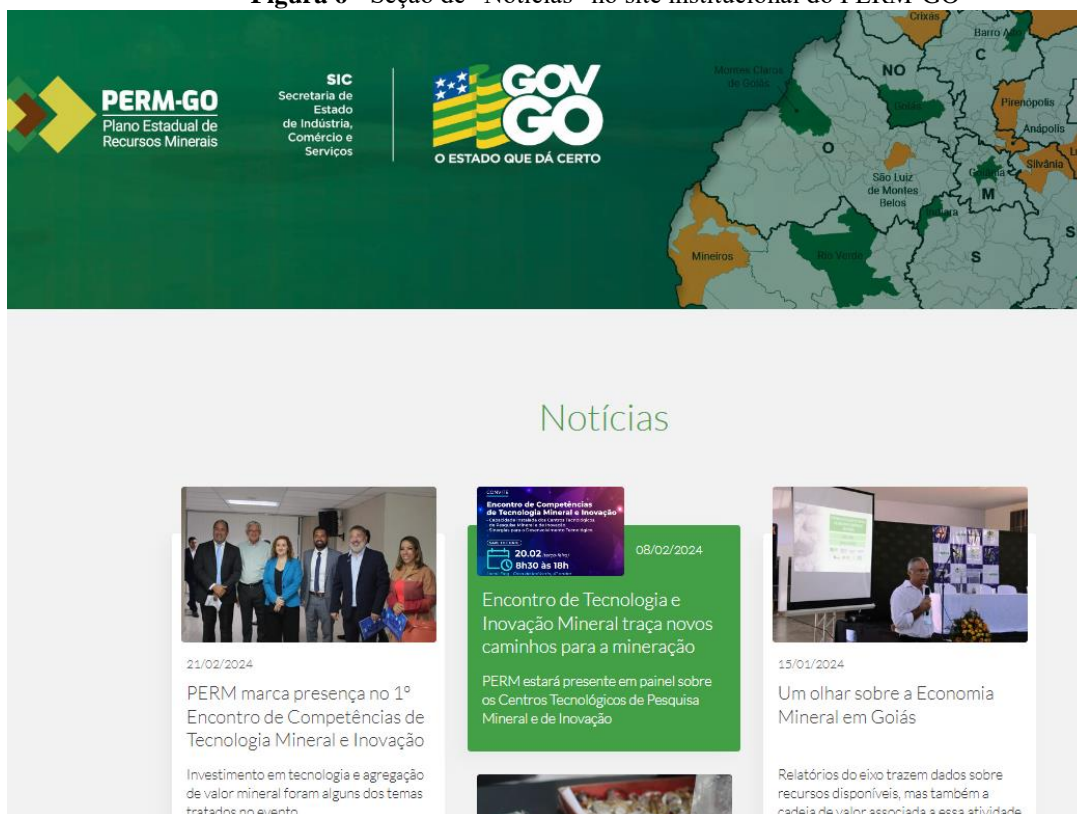
Figura 6 - Seção de “Notícias” no site institucional do PERM-GO

Além de uma divulgação dirigida à imprensa, por meio dos releases, a equipe de Comunicação do PERM-GO também disponibilizou, no site institucional, várias notícias a respeito de eventos e outras atividades promovidas pela Política Mineral Goiana ( Figura 6 ):