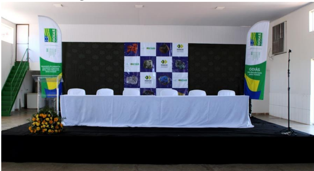
Figura 1 - Palco do evento realizado em Barro Alto

Cada oficina temática envolveu ações como: a definição das cidades e datas das oficinas; o mapeamento dos públicos de interesse em cada região; a construção de uma listagem de convidados e de autoridades; e a definição da estrutura necessária em cada local do evento, como: vagas de estacionamento, ambiente para o credenciamento, a existência de acessibilidade adequada, climatização, sistema de som e vídeo, iluminação, segurança e palco ( Figura 1 ):