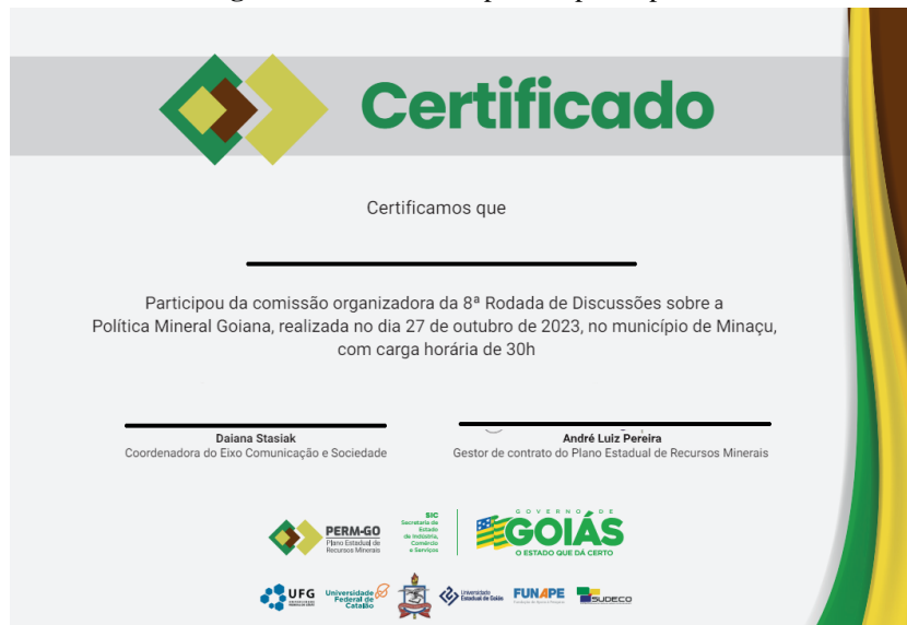
Figura 4 - Certificados para os participantes

certificados aos participantes ( Figura 4 ):