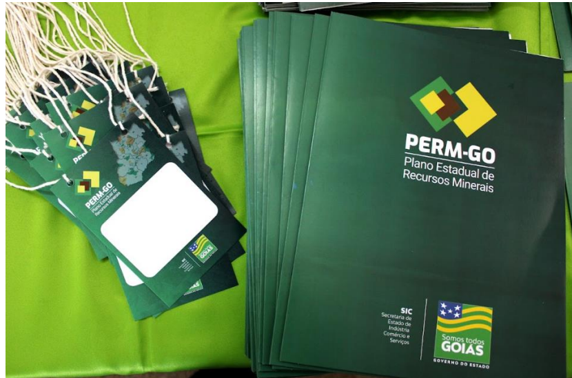
Figura 2 - Pastas e crachás distribuídos aos participantes durante o credenciamento nas oficinas

sociais, cartazes, folders, e-mail marketing , banners, faixas, crachás e pastas para os participantes, conforme mostrado nas Figura 2 e 3 :