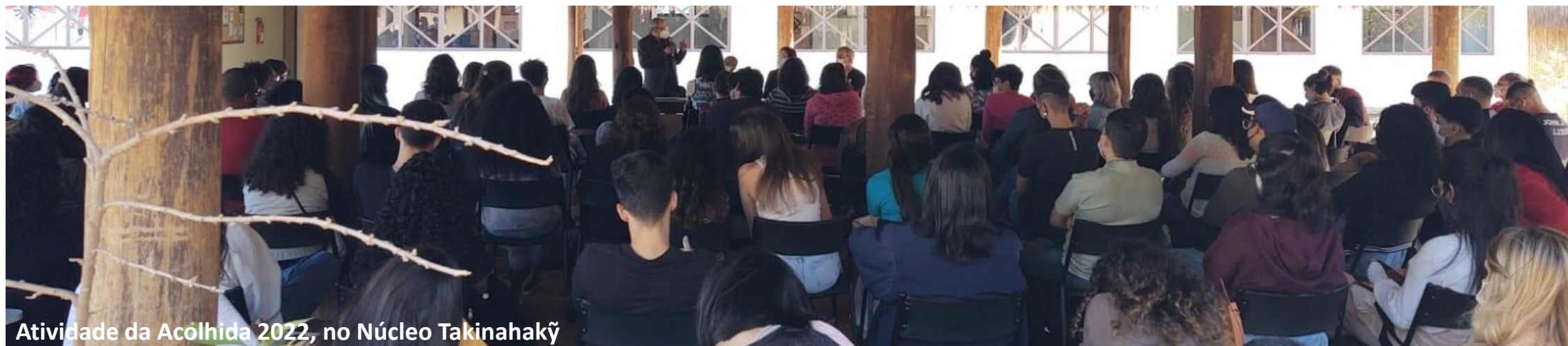
Atividade da Acolhida 2022, no Núcleo Takinahakỹ

De 17 a 20/4, a FCS recebe alunxs dos cursos de Museologia, Relações Internacionais, Ciências Sociais – Políticas Públicas e Ciências Sociais – Bacharelado e Licenciatura na Acolhida 2023 , que marca o início do novo ano letivo na UFG. As coordenações de cursos e os centros acadêmicos farão o contato direto, que envolve toda a Comunidade Acadêmica, em especial aqueles que estão em seu primeiro encontro com a FCS e a UFG. A íntegra da programação, também disponível no site da Faculdade, pode ser acessada nas versões para cursos diurnos ( aqui ) e noturnos ( aqui ).