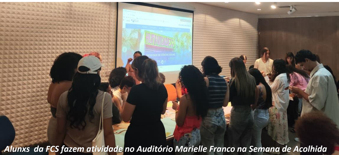
Alunxs da FCS fazem atividade no Auditório Marielle Franco na Semana de Acolhida

Durante a primeira semana de março, a inaugural deste semestre letivo, a FCS realizou a Semana de Acolhida às/aos ingressantes nos cursos de graduação da unidade. As atividades de boas-vindas ocorreram nos turnos da manhã e da noite, elaboradas e promovidas conjuntamente pelas coordenações de curso, Direção da unidade e as representações estudantis.