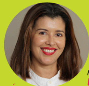
MEDIAÇÃO: LÍVIA FERREIRA