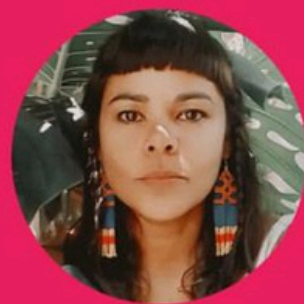
MEDIAÇÃO: CÁSSIA OLIVEIRA

BIBLIOTECA DA ESCOLA, LUGAR DE LER E APRENDER: relatos de experiências