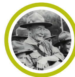
Robert Stephenson Smyth Baden-Powell Fundador do Escotismo

Criada em 1924, é uma associação sem fins lucrativos que desenvolve trabalhos de educação continuada de crianças e jovens, valorizando o equilíbrio ambiental e o desenvolvimento social na formação de cidadãos conscientes e atuantes.