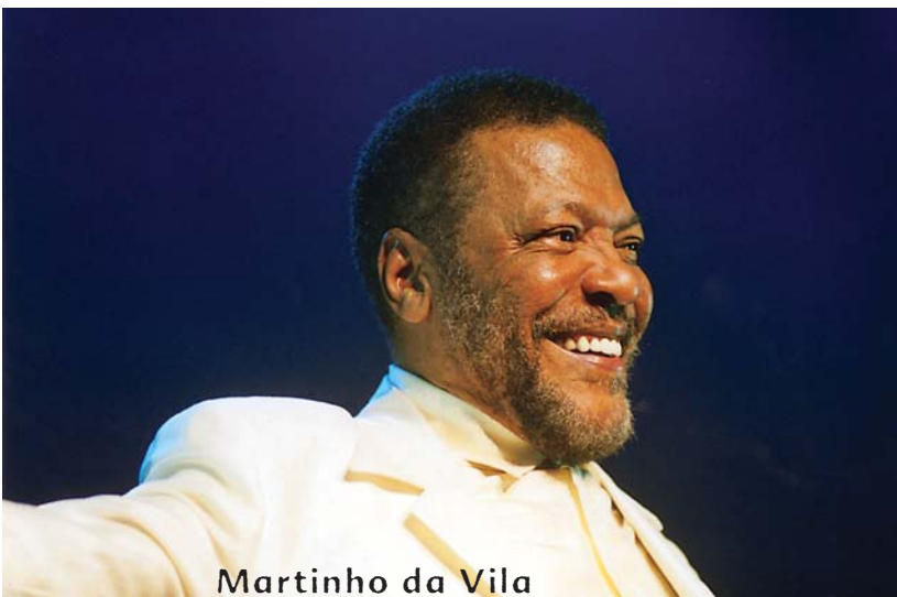
Martinho da Vila

A Bahia ainda dá as cartas no mercado nacional – se levada em conta a origem de ícones da MPB como Caetano